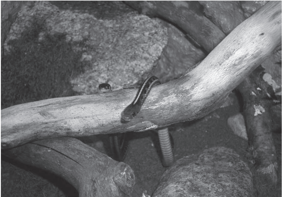
Thamnophis sirtalis infernalis en Thamnophis sirtalis pickeringii .