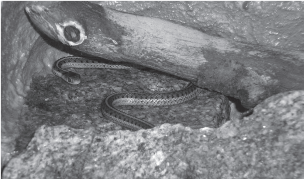
Thamnophis sirtalis parietalis .