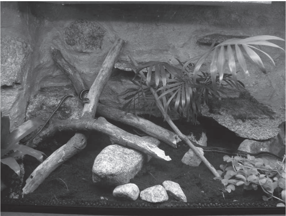
Thamnophis sirtalis infernalis en Thamnophis sirtalis pickeringii op verkenning/inspecting their vivarium.