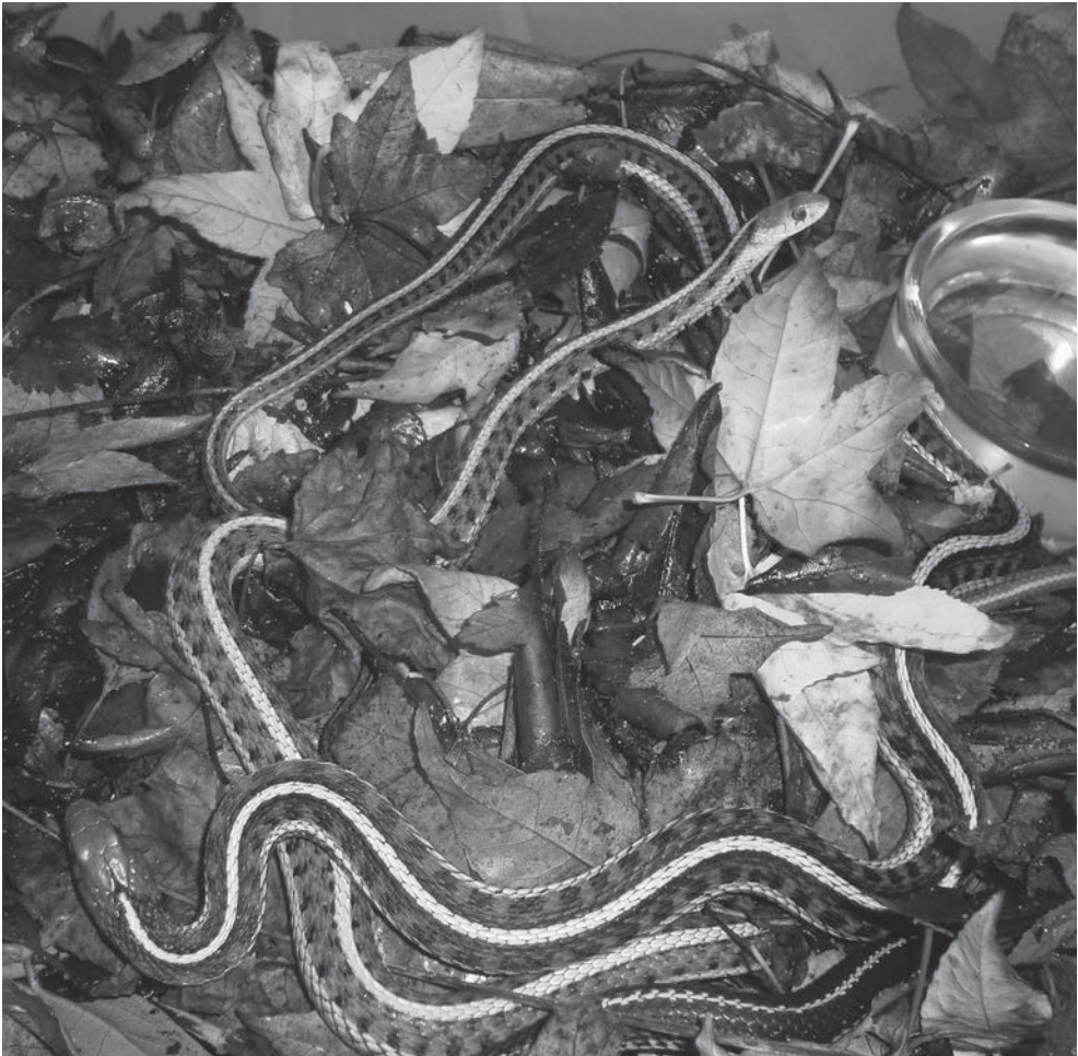
Winterrust setup/Hibernation setup.